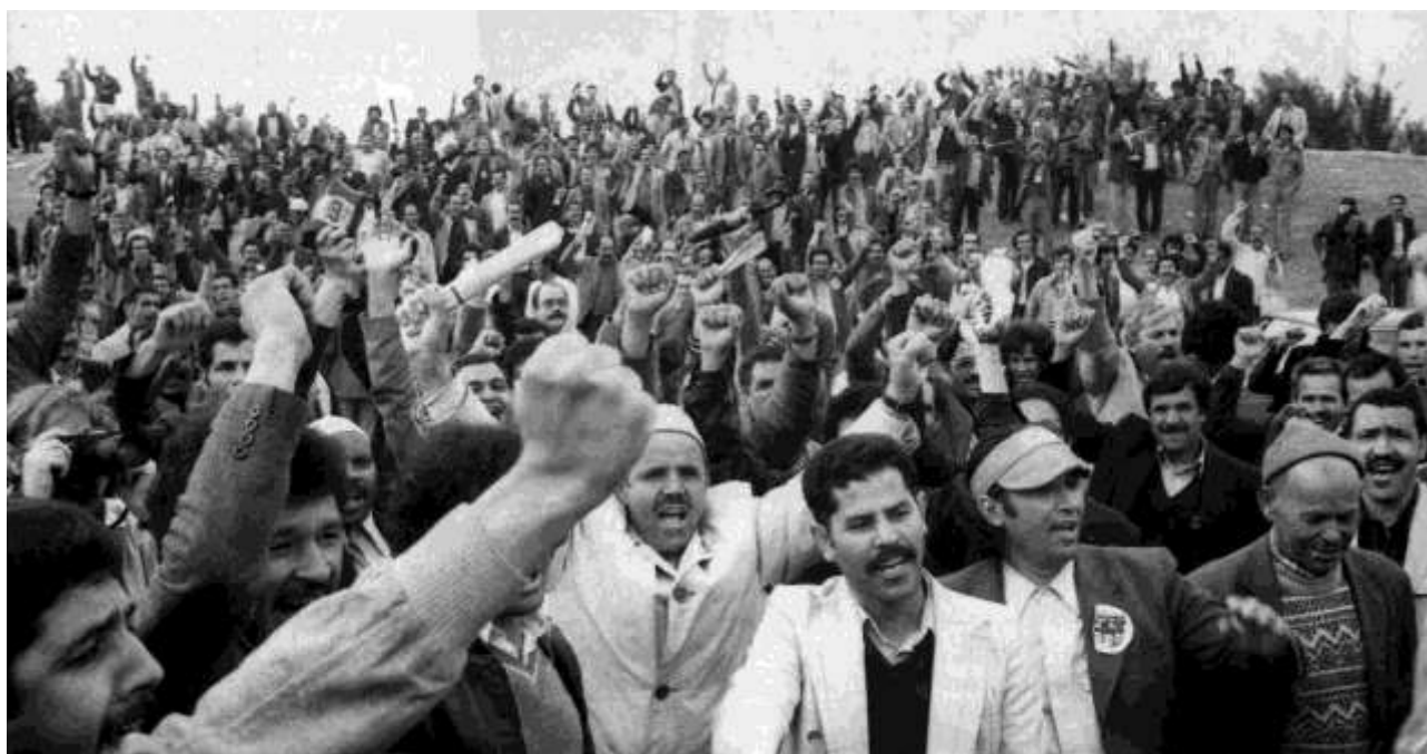
Fin de grève victorieuse à Citroën (Aulnay-sous-Bois, 1982)

calisme en France. Cette brochure donne une idée des difficultés rencontrées dans ce sens au cours de l'Histoire ouvrière et syndicale. Le travail ouvrier est réputé, à juste titre, être un travail difficile, la recomposition syndicale l'est aussi... Cela ne nous arrêtera pas !