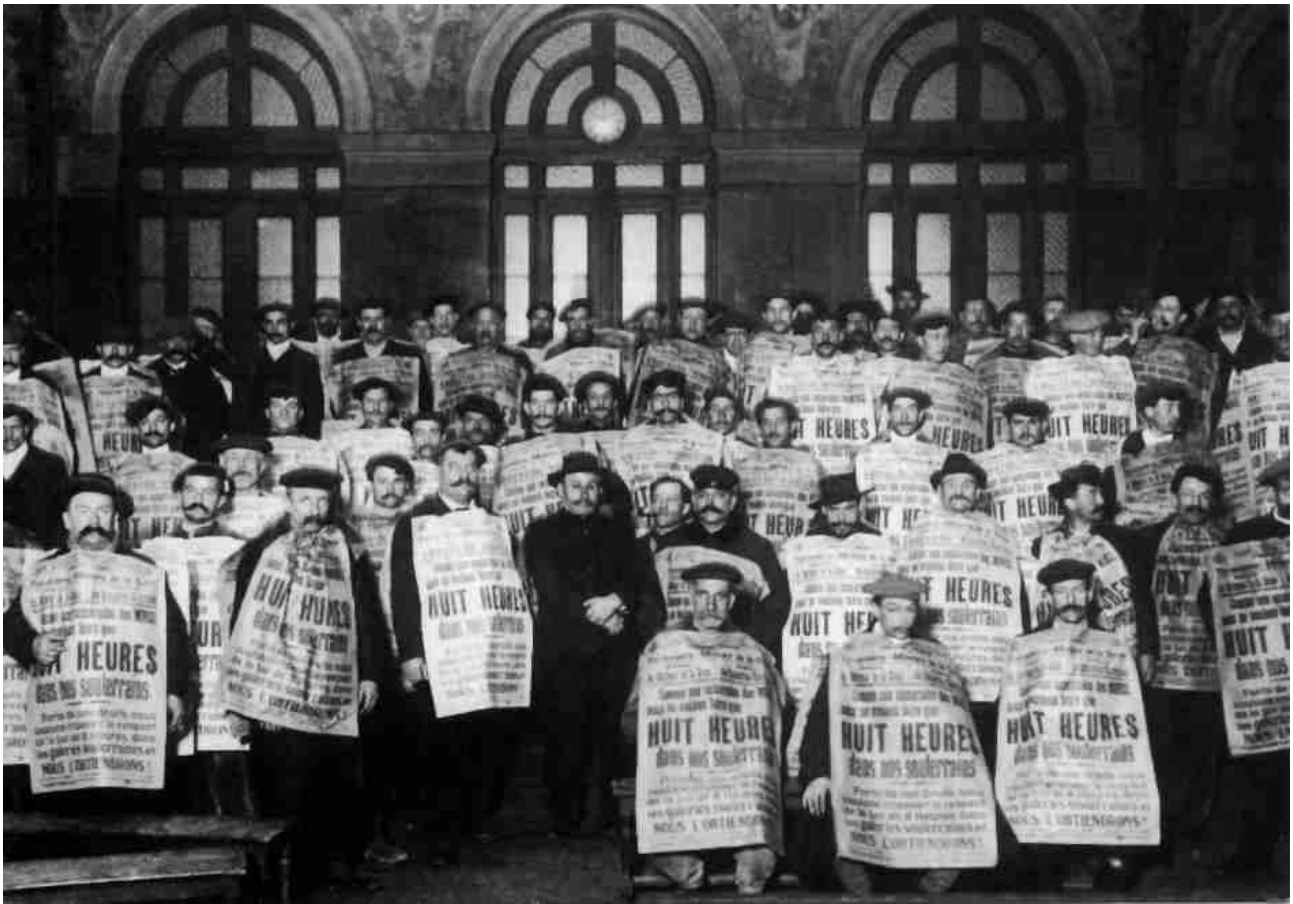
Terrassiers du métro en lutte pour la journée de 8 heures (Paris, 1913)

avec l'apolitisme ; le syndicalisme ne peut être apolitique quand il remet en cause la société toute entière. À la République bourgeoise, le syndicalisme d'action directe oppose la République des travailleurs :