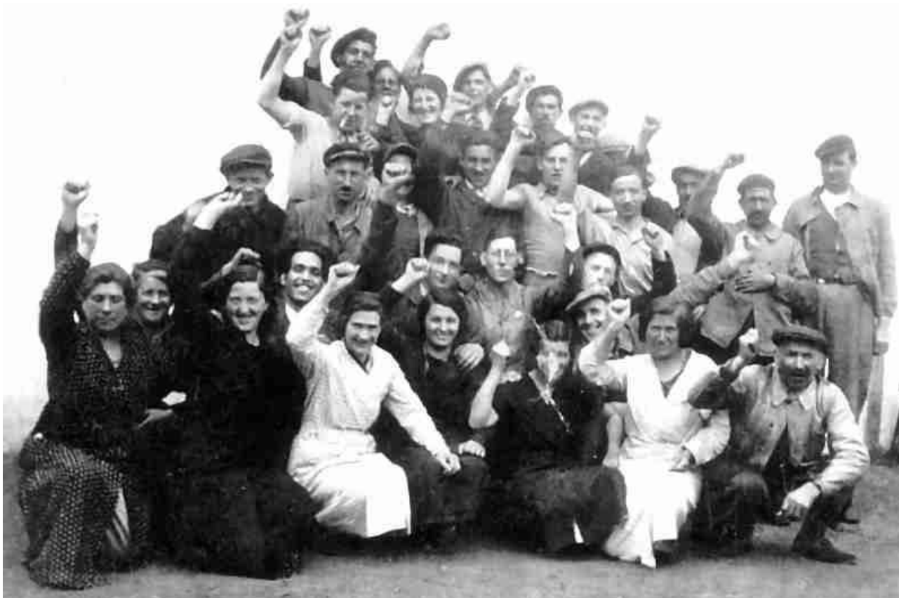
L'usine de Dives occupée

Suite au pacte germano-soviétique du 23 août 1939, et à l'entrée des troupes russes en Pologne le 17 septembre le bureau confédéral de la CGT prononce l'exclusion des communistes. Le 26 septembre 1939 le parti communiste est dissous et interdit sur tout le territoire français.