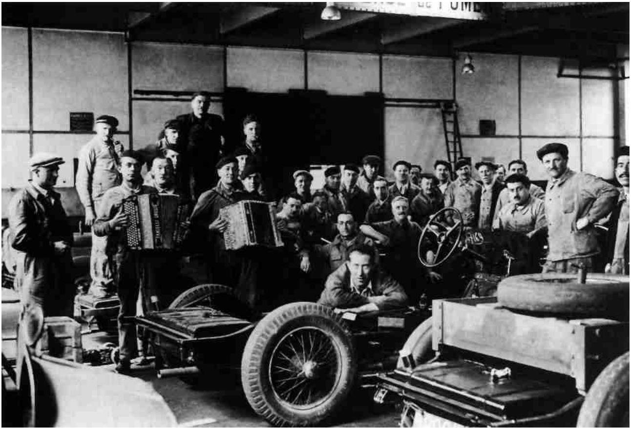
Ouvriers des usines Delahaye en grève (1936)

qu'au niveau des unions départementales et des fédérations se réunissent des congrès d'unité. Le congrès d'unité se tient à Toulouse du 2 au 5 mars 1936.