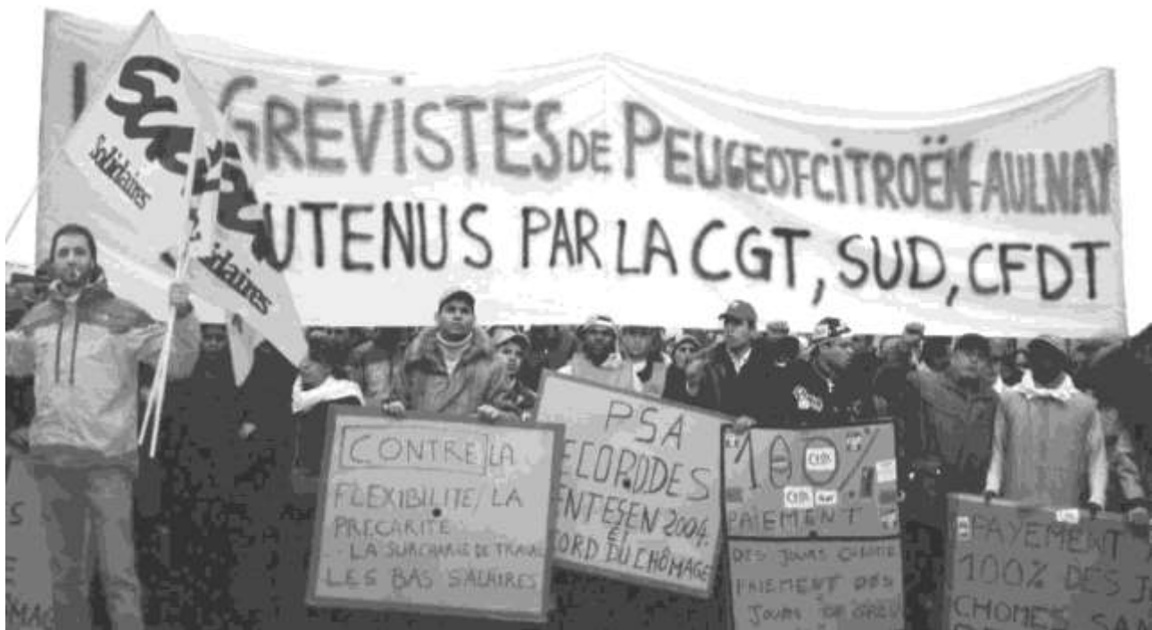
Manifestation de Peugeot-Citroën Aulnay-sous-Bois

Les vagues de licenciements reprennent et les grévistes ont la possibilité au printemps 2001 d'organiser une marche importante des entreprises victimes à nouveau de plans sociaux (LU-Danone, Marks & Spencer, Air Liberté...). C'est le début des « licenciements boursoiers » (chez Michelin) sous la pression des actionnaires dans des entreprises qui font du profit. En Basse-Normandie chez Moulinex, les ouvrières doivent faire face à des licenciements à répétition de 2001 à 2004, jusqu'à la fermeture complète de l'entreprise. Elles n'obtiendront réparation qu'en 2007, après des années de lutte et un long procès aux prud'hommes. Face à ces licenciements le gouvernement « de gauche » se déclare impuissant ; « l'État ne peut pas tout » répond le premier ministre Lionel Jospin à l'interpellation des Michelin. Cependant des réactions de résistance acharnée ont lieu comme celle des salariés de STMicroelectronics à Rennes en août 2003, contre la fermeture du site. Les salariés s'affronteront aux gardes mobiles pendant que la fédération CFDT de la métallurgie liquidera la grève en retirant leurs mandats aux militants à la pointe du mouvement.