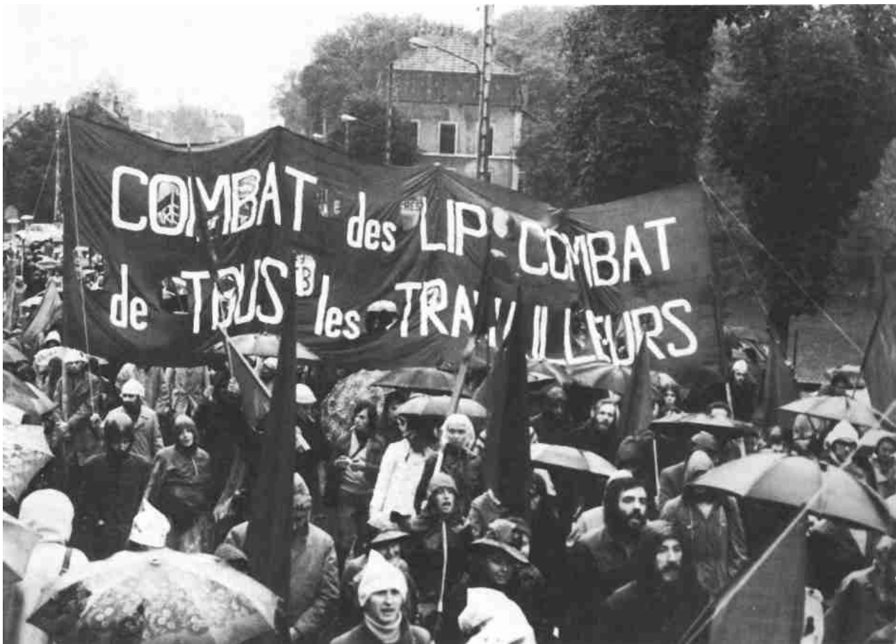
Le combat des Lip (1973)

Enfin cette période est aussi caractérisée par le développement des luttes sur d'autres terrains : cadre de vie (transports, urbanisme) ; lycéens protestant contre la loi Debré au printemps 1973 (remise en cause du système des sursis), lutte des femmes contre les discriminations sexistes (MLF 55 , MLAC 56 ). A partir de 1974 et du « choc pétrolier » la crise frappe durement les salariés et c'est contre les licenciements principalement que s'opposeront ces derniers. La grande lutte des sidérurgistes contre une diminution de près de 70 % des emplois en France clôt la période. La CFDT, puis la CGT créent des radios pirates sur le bassin et la ville de Longwy. Malgré la force publique, avec le soutien de toute la population la radio CGT