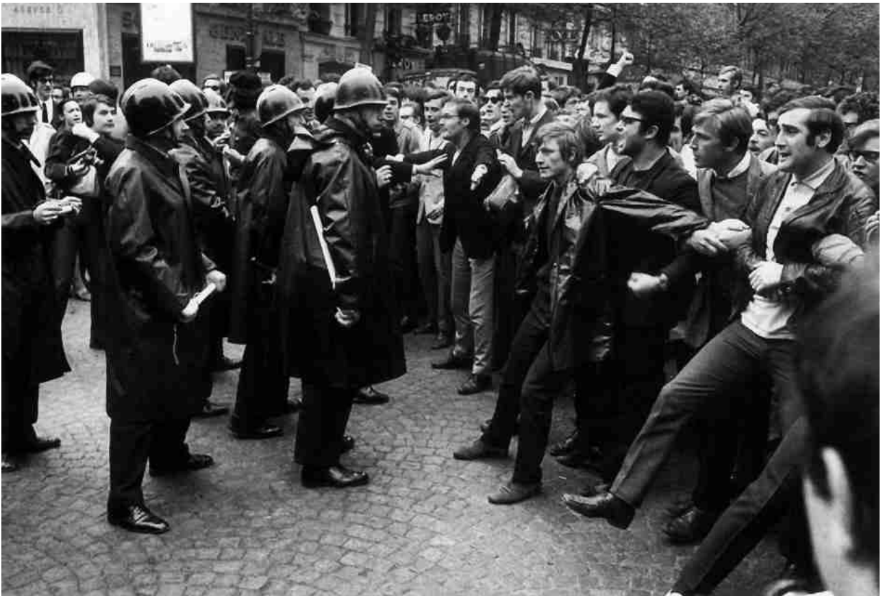
Manifestation (Paris, 1968)

partis de gauche ; la FGDS 45 réclame des élections. De Gaulle reste silencieux ; dans sa première intervention, le 24 mai, il propose un référendum sur le thème de la participation. Son intervention apparaît surtout comme une demande de blanc-seing sur un projet sans consistance ; il s'agit ni plus ni moins d'un plébiscite.