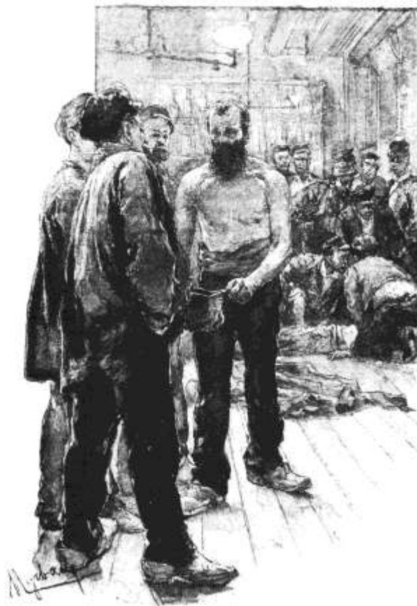
La grève des forgerons : quête de solidarité

Par ailleurs, des rencontres entre syndicalistes et leaders ouvriers de différents pays aboutissent à la création à Londres en 1864 de la I ère Internationale (Association internationale des travailleurs). L'AIT (1864 – 1872) va fournir des cadres et une pensée au mouvement ouvrier français.