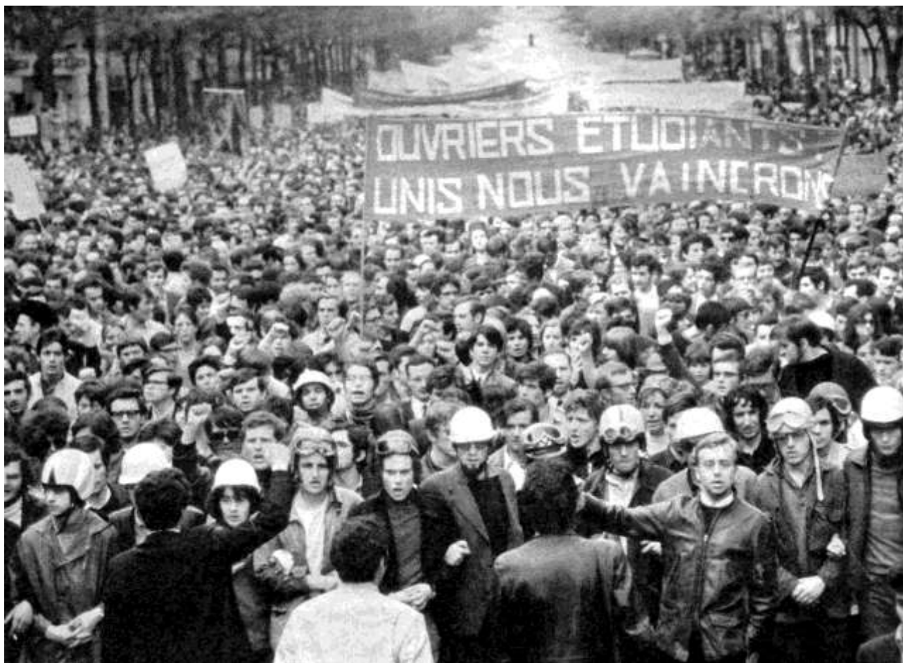
Manifestation (Paris, 1968)

Une nouvelle journée nationale d'action à l'appel de la CGT, de la CFDT et de la FEN, entraîne grèves et manifestations le 1 er février 1967. Parallèlement à ces actions décidées du sommet, on voit surgir des conflits particuliers (Rhodiacéta, Chantiers de Saint-Nazaire, Berliet). Pour protester contre les menaces portées par le gouvernement sur la Sécurité sociale, une nouvelle grève générale de 24 heures réu-