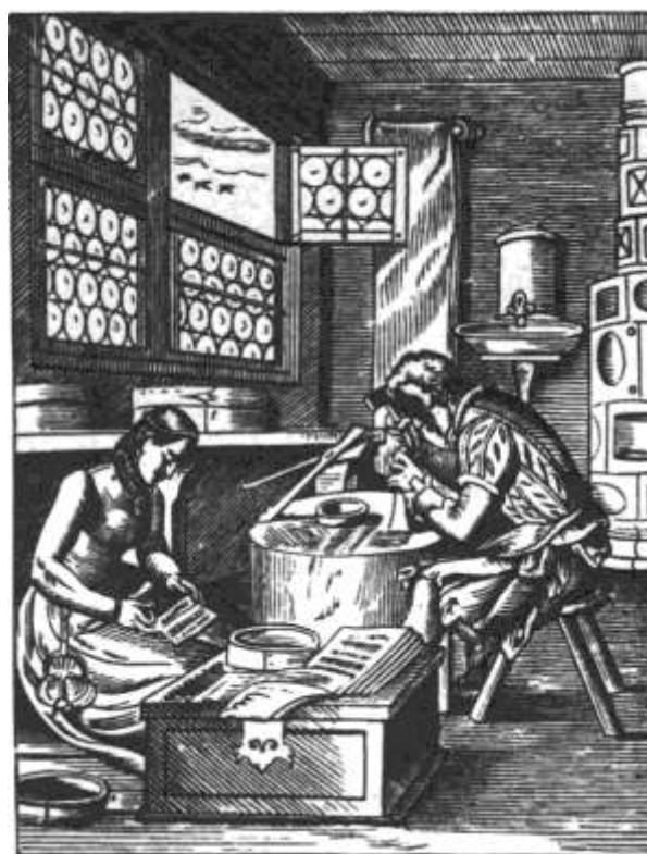
« Fermailleurs » (orfèvres, XVI e siècle)

Avec le développement de l'imprimerie après 1455 2 , Lyon est depuis peu la capitale de l'industrie en France avec l'édition de livres et l'introduction du ver à soie qui permet la création d'une industrie de filature et de tissage. On peut ici situer ce qui fût sans doute la première grande grève ouvrière en France, La Grande Rebeayne, qui fût le fait des ouvriers imprimeurs de Lyon en 1529 et qui finit en