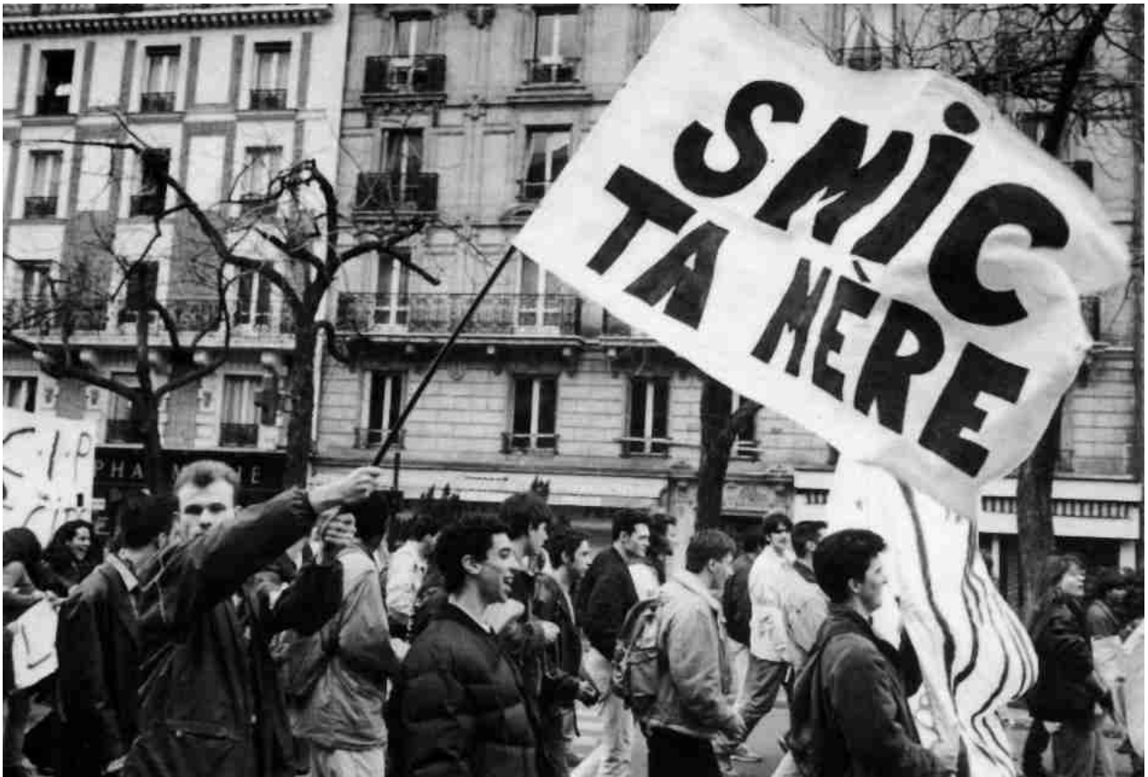
Manifestation contre le Contrat d'Insertion Professionnelle (Paris, 1994)

reste la catégorie sociale la plus nombreuse dans la population active après celle des employés.