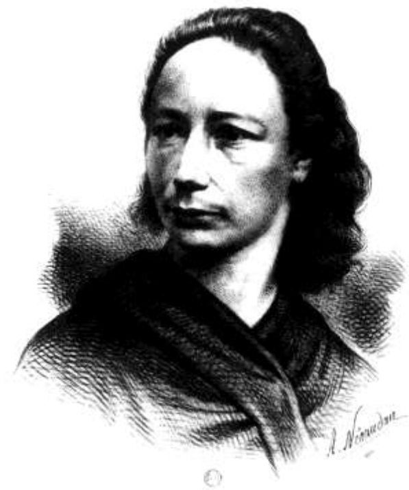
LOUISE MICHEL (d'après nature)