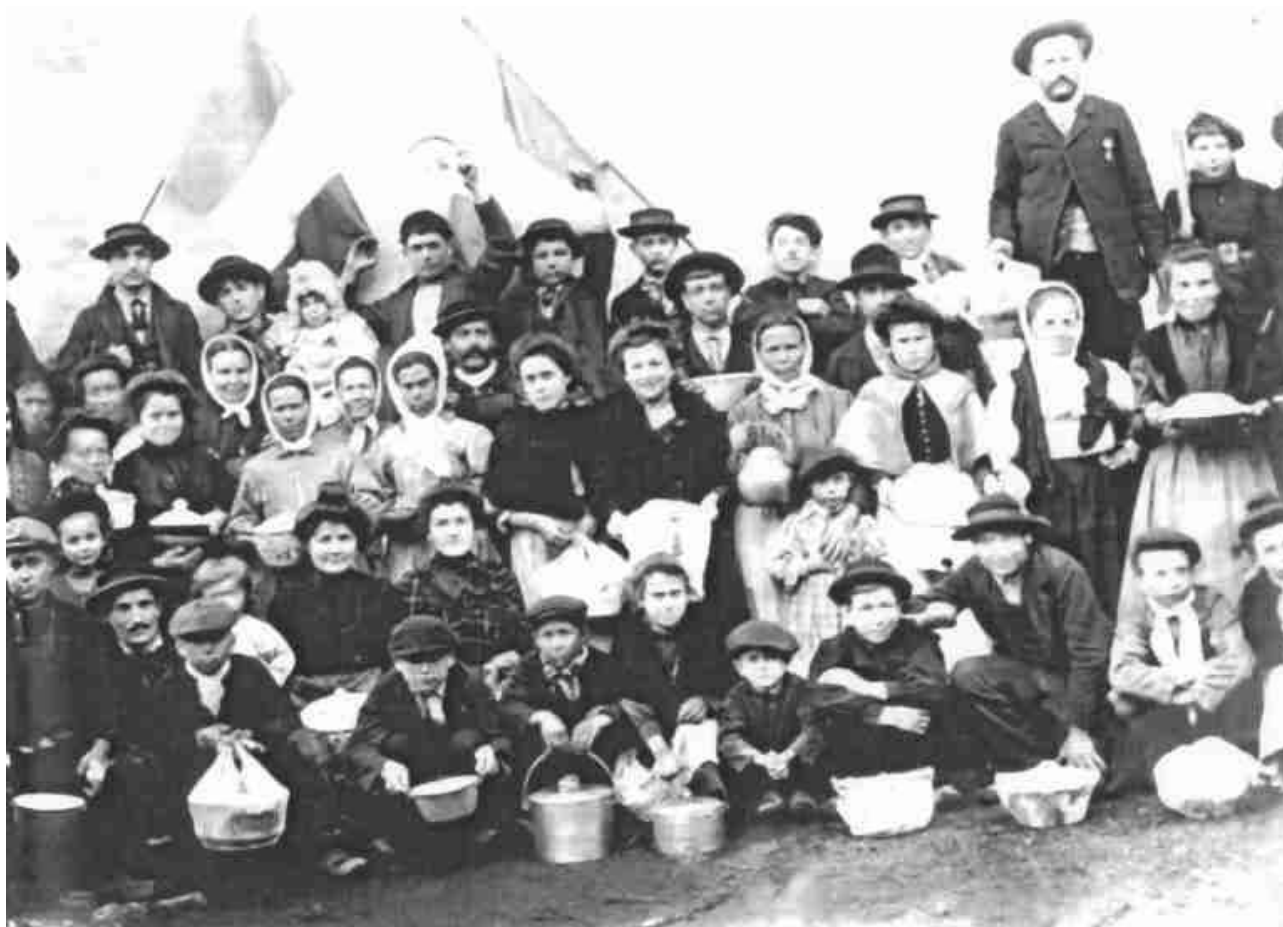
La « soupe communiste »

En août 1944 la CGT et la CFTC lancent l'ordre de grève générale insurrectionnelle. Dès le 27 juillet 1944, une ordonnance du gouvernement d'Alger avait rétabli la liberté syndicale et annulé les décrets de 1940.