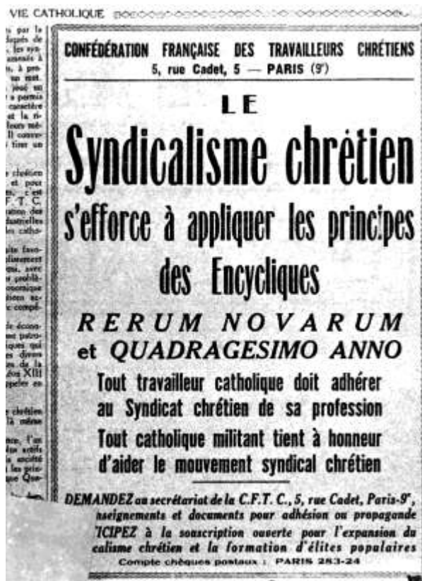
Encart de la CFTC dans le journal « la Vie Catholique » (1931)

Ces catholiques ont des difficultés pour se faire reconnaître comme syndicats par le monde catholique qui ne reconnaît que les syndicats mixtes et qui va plutôt favoriser les syndicats « jaunes » 35 , lesquels se développent et auront même pendant quelques années un journal, une Fédération nationale des jaunes.