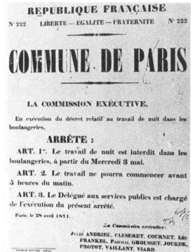
Affiche (Paris, 1871)

A cet attachement à des conceptions anciennes va s'opposer un nouveau mouvement témoignant d'un renouvellement par la base des organisations ouvrières.