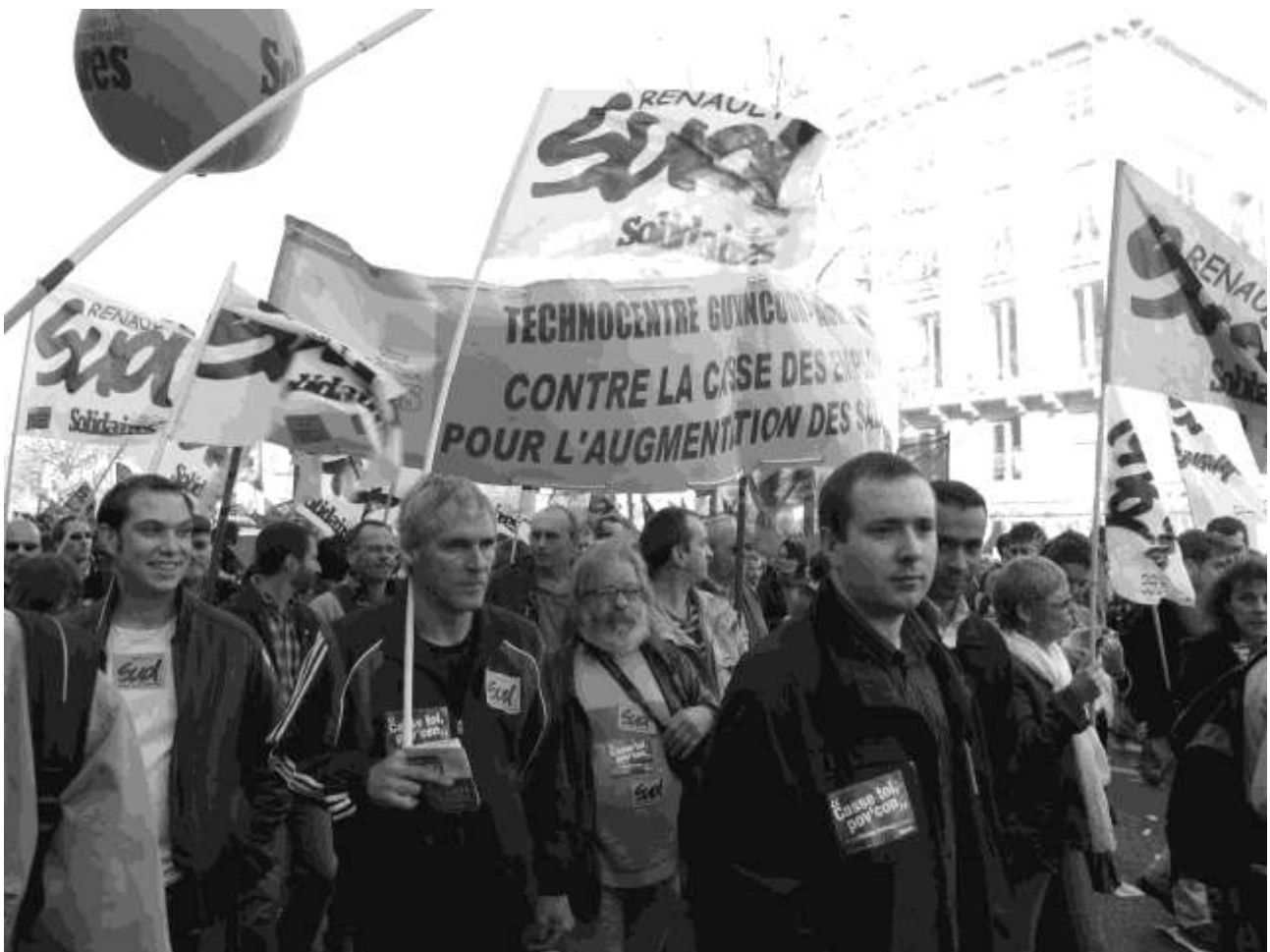
Manifestation de Renault Guyancourt

Le « Mouvement des chômeurs » de l'hiver 1997 – 1998 est également caractérisé par ce soutien de l'opinion publique et par l'importance de l'apparition médiatique. Il fait apparaître au grand public de nouveaux « acteurs sociaux », en l'occurrence les chômeurs. Ce genre de regroupement militant sera exporté dans quelques autres pays d'Europe, ce qui permettra la création du Réseau des marches européennes à l'initiative de manifestations convergentes, en 1997 à Amsterdam et en 1999 à Cologne, à l'occasion de la réunion de sommets européens.